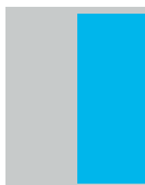
1/2 вертикаль 115 x 285 мм +5 мм